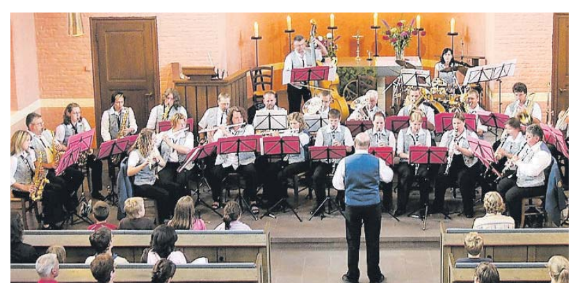
Das große Orchester des Niederlinxweiler Vereins.

♦ Karten gibt es für fünf Euro an der Abendkasse oder bei Musikern des Orchesters.