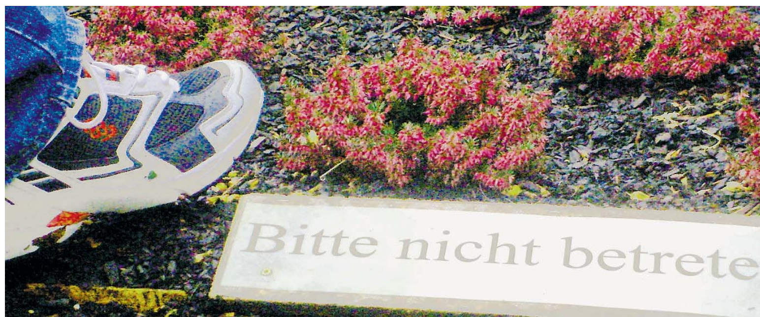
Niklas Dannheimer aus Furschweiler siegte mit dieser Aufnahme aus Mausperspektive in der Gruppe bis 16 Jahre.