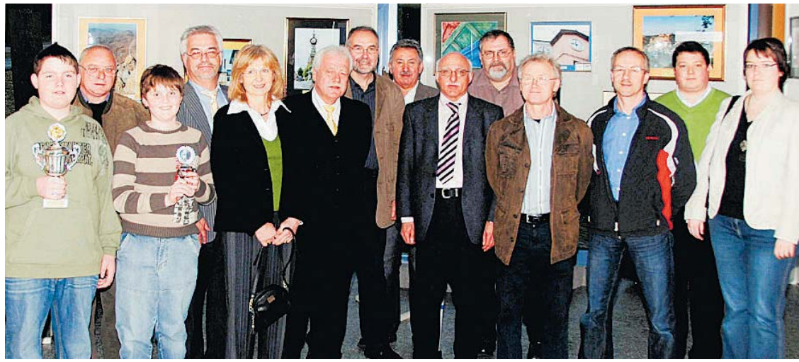
Die Preisträger der Clubmeisterschaft beim Fotoclub mit Bürgermeister Alles.