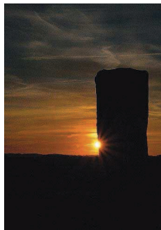
Platz zwei: „Mystisch“ nennt Ilka Ballof aus Niederkirchen ihr Wettbewerbs-Foto.