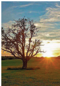
Platz fünf: „Abendstimmung“ heißt das Bild von Edwin Schöneberger aus Schiffweiler.