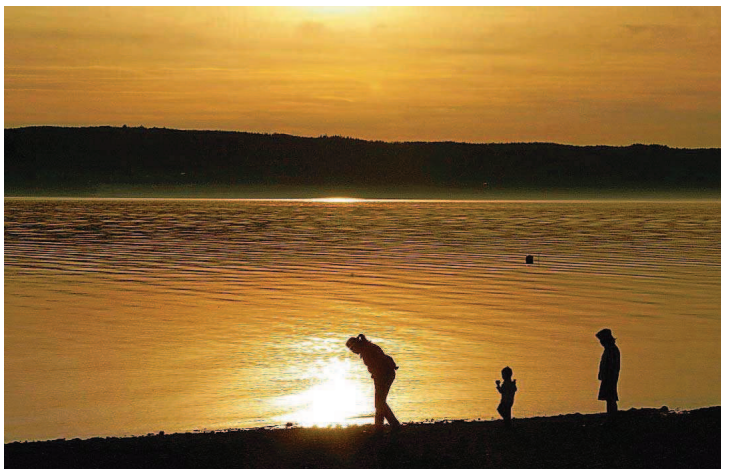
Platz drei: Monika Schmidt aus Urweiler landet mit „Urlaub“ auf dem Bronze-Rang.