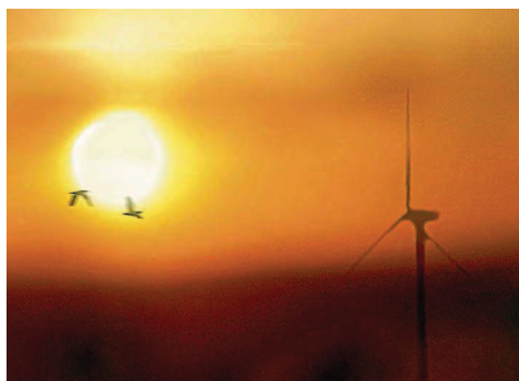
Platz acht: Energiewende von Ulrich Höfer aus Dudweiler.