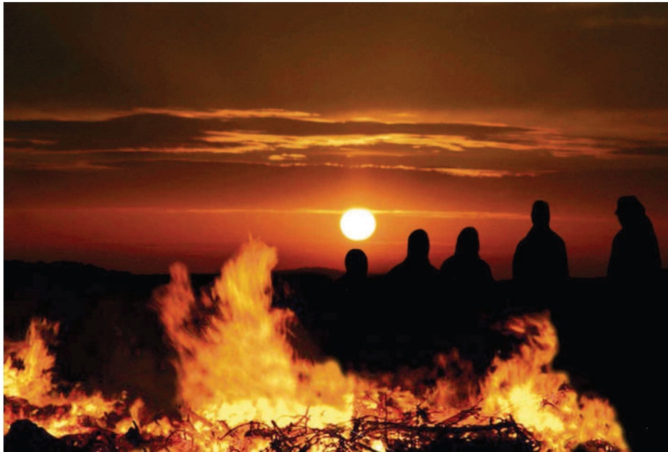
Das Siegerbild fotografierte Wolfgang Ballof aus Niederkirchen. Er nennt sein Foto „Sonnwendfeier“.

Bild des Monats Juni Das ganze Jahr über wählt die Jury der SZ-Redaktion St. Wendel aus den Bildern des Fotoclubs Tele Freisen das jeweilige „Bild des Monats“. Das Motto gibt die SZ dabei vor. Im Juni lautete es „Sommersonnenwende“.