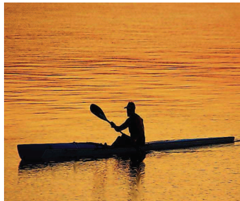
Platz vier: Werner Schmidt aus Urweiler nennt sein Bild „Der Sonne entgegen“.