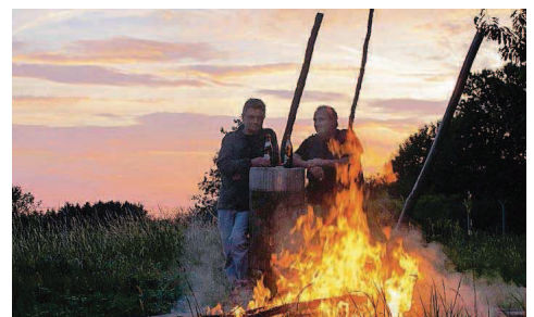
Platz sechs: „Wendefeuer“ von Eva Maria Böhme aus Oberkirchen.