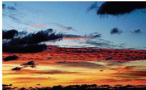
Platz neun: „Warten auf den Sommer“ von Jürgen Kremp aus Hoof.