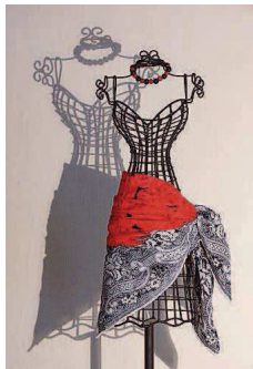
Februar: Modell Bolero zum Thema Umwickelt.