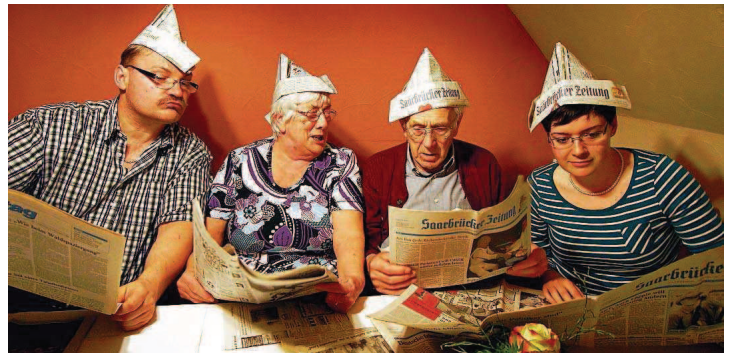
März: Thema 250 Jahre SZ Seit Generationen gut.