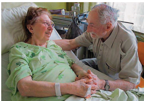
November: Das Foto In guten und schlechten Tagen zum Thema Bund für's Leben.