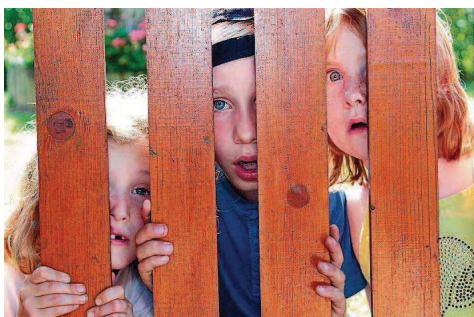
September: Erwischt zum Thema Neugier.