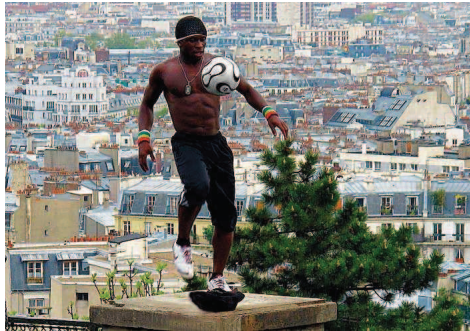
Juli: Über den Dächern von Paris zum Thema Bälle.