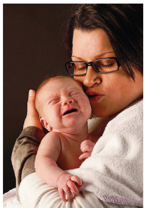
Oktober: Alles wird gut zum Thema Emotionen.