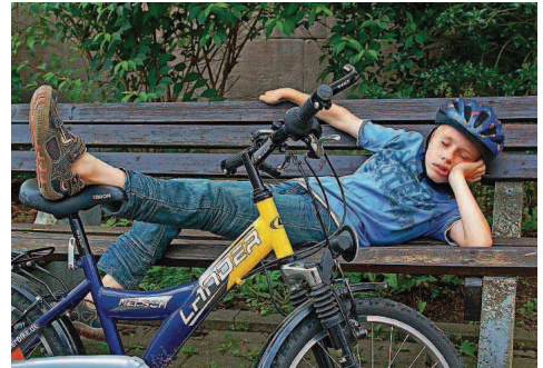
August: Geschafft zum Thema Pause.