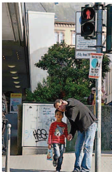
April: Das Foto Rot zum Thema Vorbilder.