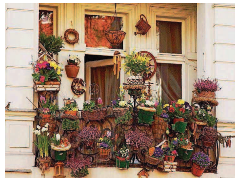
Mai: Blumenpracht zum Thema Balkone.

PRODUKTION DIESER SEITE: HANNELORE HEMPEL MELANIE MAI