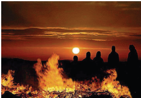
Juni: Sonnenwendfeier zur Sommersonnenwende.